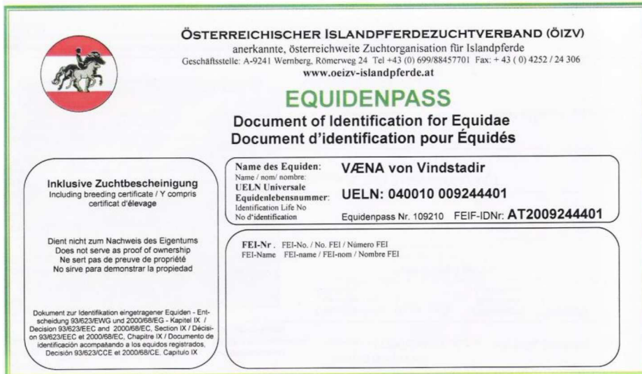
Image 01 Deckblatt